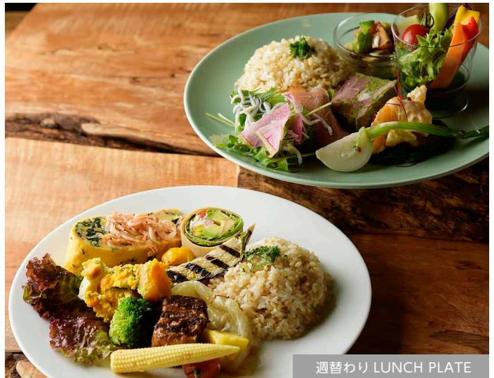
週替わり LUNCH PLATE