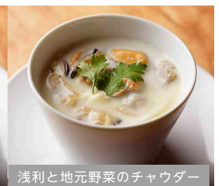
浅利と地元野菜のチャウダー

※ 食物アレルギーをお持ちのお客様がいらっしゃる場合は、スタッフまでお声掛けください。